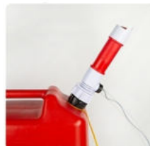
Установите насос в канистру