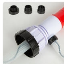
Установите подходящий адаптер для заливной горловины