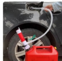
Вставьте заливной шланг в бензобак